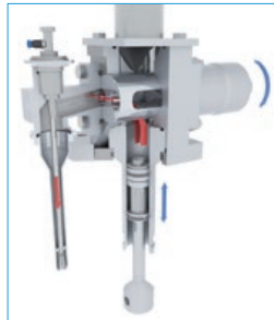
Système de remplissage avec optimisation du débit et facilité de nettoyage