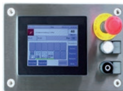
IHM 5,7" standard