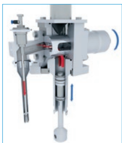
Système de remplissage avec optimisation du débit et facilité de nettoyage